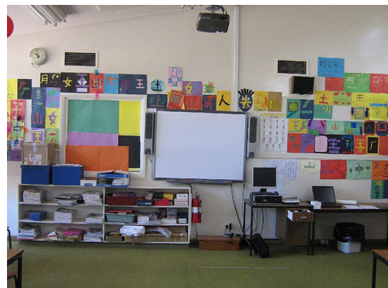
falsches, weil unruhiges Arrangement

Die grüne Kreidetafel bietet einen relativ ruhigen Hintergrund für verschiedenste Poster, Plakate usw. sowie einen Abstand zur Wand (wo vielleicht noch Lernplakate hängen). Auf dem Smartboard ist eher mit Vielfältigkeit und Farbigkeit zu rechnen. Man muss aufpassen, dass das gesamte Arrangement nicht zu unruhig und unübersichtlich wird.